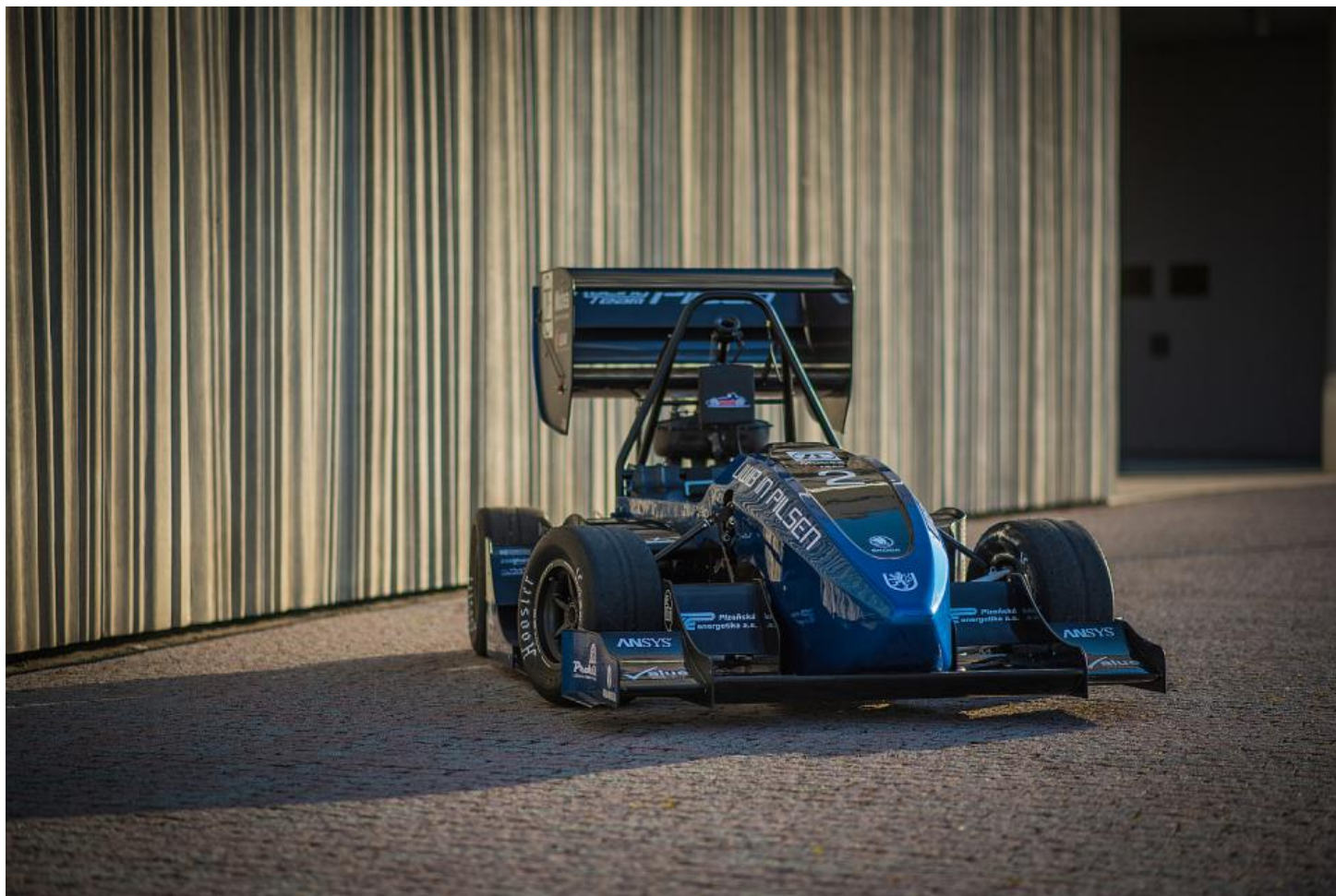
Racing Team Pilsen s novou formulí UWB05

Funkční závodní auto sestrojil tým ze tří fakult - strojní, elektrotechnické a aplikovaných věd. Příprava nového modelu, na němž pracovalo 23 studentů, trvala rok. S návrhem monopostu začal tým vloni na podzim. První součástky šly do výroby v lednu, kdy začala i výroba vozu. „Formule staví plzeňští studenti už deset let. S vlastnoručně vyrobenými vozy pak závodí v mezinárodní soutěži Formula Student, do které hlásí svá auta technické univerzity z celého světa,“ sdělila mluvčí univerzity Šárka Stará.