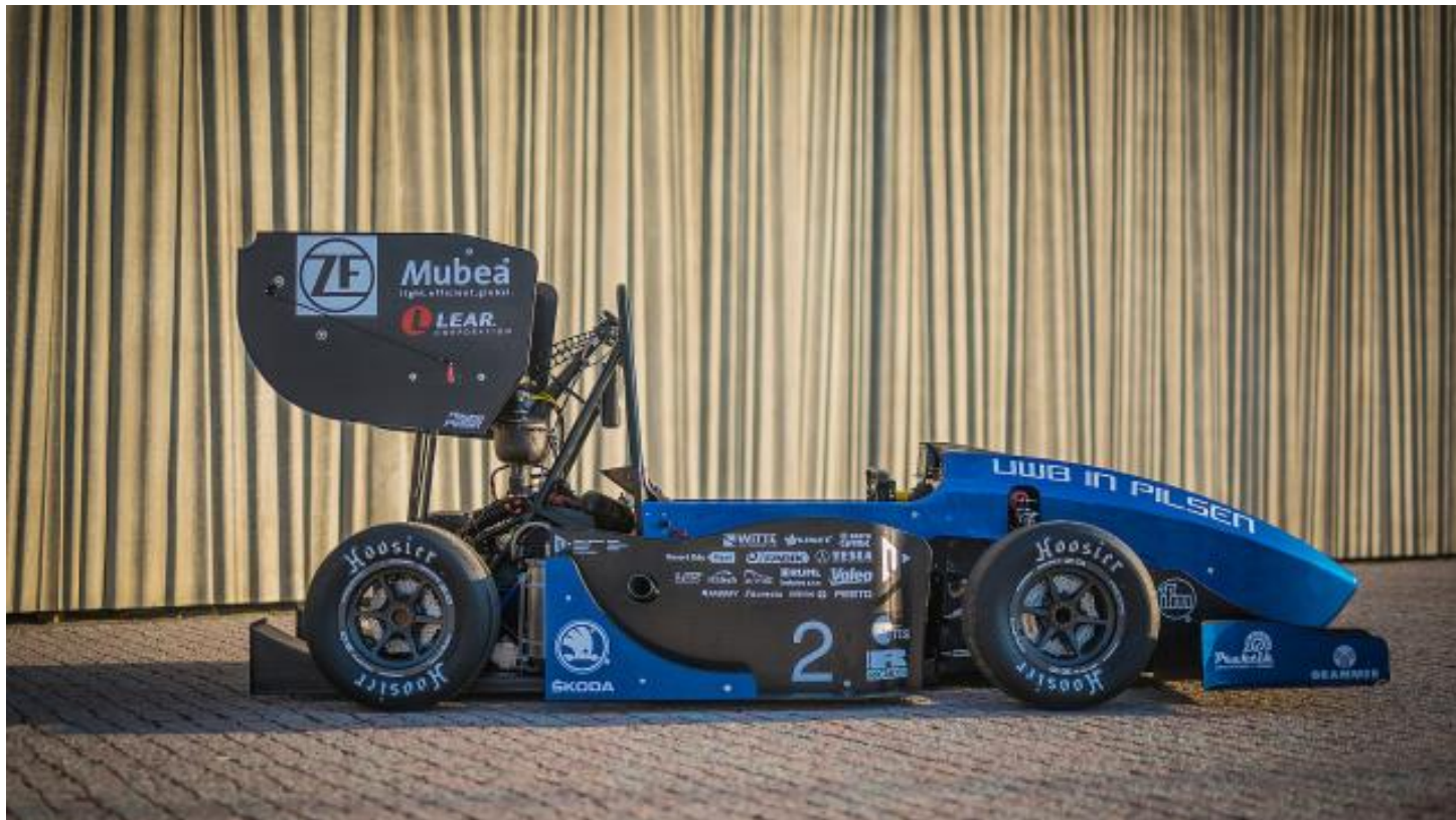
Studentská formule UWB05

„Formule jede rychlostí do 120 km v hodině, máme celkem 6 řidičů a každý jede dvě disciplíny,“ řekl Mrázek, který vůz také na závodech řídí. „Je to docela adrenalin, samozřejmě při závodech musí jít nervy stranou a je potřeba bojovat za celý tým,“ přiznal s tím, že i formule musí být sestavená podle bezpečnostních pravidel a že na bezpečnost se dbá i během závodu: „Trať je vždy na otevřeném prostranství, aby nemohlo dojít k havárii, na trati je pouze několik aut a pro předjíždění jsou vyhrazené zóny.“